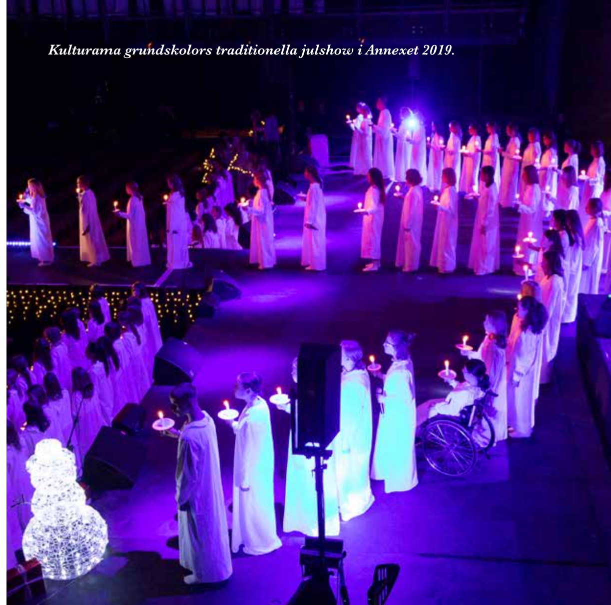
Kulturama grundskolors traditionella julshow i Annexet 2019.

Skolan ligger i Sundbyberg och här går cirka 500 elever i årskurs 4-9 och här finns inriktningarna Bild & Form, Musikal och Musik & Sång.